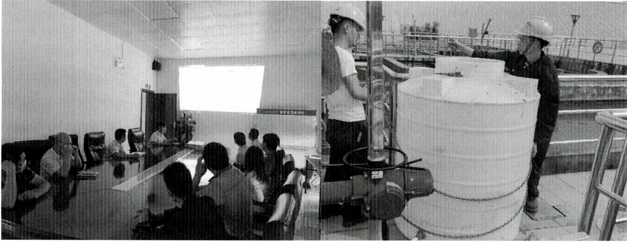
图 1. 组织开展环保应急预案演练