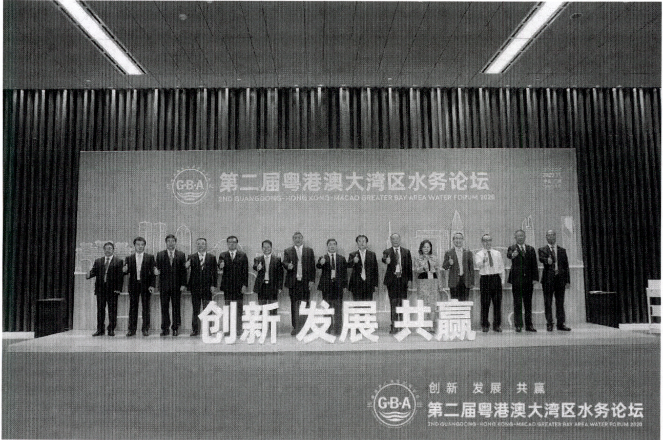
图 3. 积极参加“粤港澳大湾区水务论坛”活动

公司环境信息及时向社会公众进行披露，积极参与各类大型活动，为地方经济发展贡献力量，并获得当地政府部门的表扬。