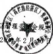
图 4. 高栏港区规划建设环保局发来表扬信