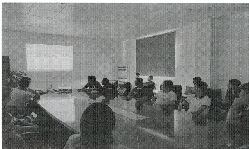
图 2. 员工培训

公司 2020 年底现有员工 35 人，公司为员工提供了良好的工作生活环境，注重加强员工的技能培训教育。公司员工的稳定为公司的安全环保生产提供了坚实的基础。